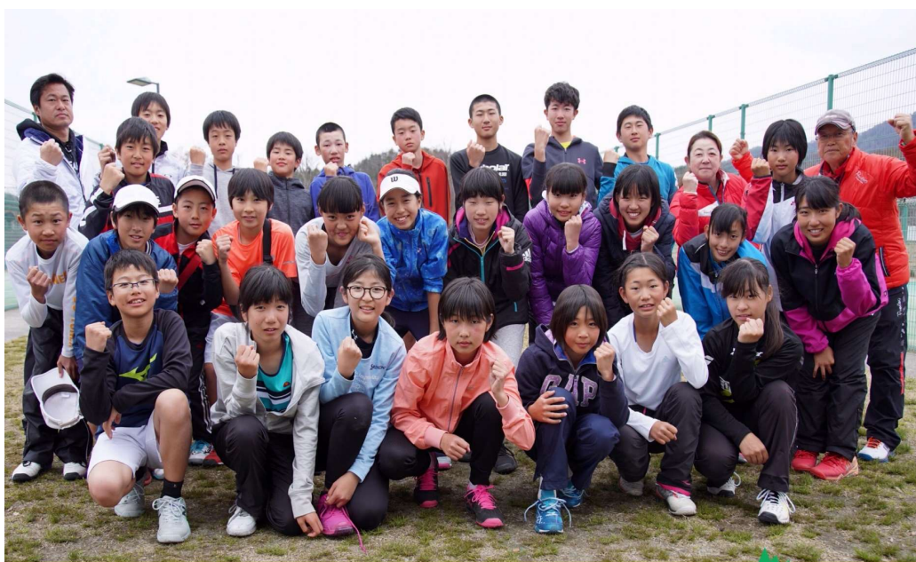
2019 にいがたトレセン・ジュニアリーグ第1回 4/13,14 村上市・荒川テニスコート